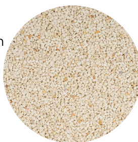
Marfil Tamaño: 2-4 y 4-6 mm