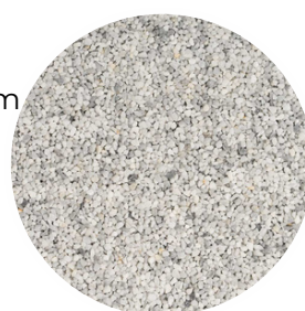
Light Grey Tamaño: 2-4 y 4-6 mm