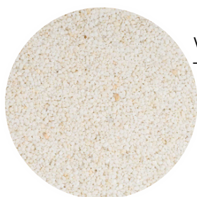
White Tamaño: 2-4 y 4-6 mm

Avec la gamme STONECARPET, la variété des finitions est infinie. Utilisant uniquement de la pierre de marbre, nous proposons une large palette de couleurs et de granulométries pour nous adapter à tous les styles et préférences. Les pierres de marbre peuvent être mélangées, offrant ainsi des possibilités infinies.