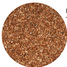
Red Tamaño: 2-4 y 4-6 mm