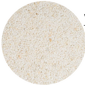
White Tamaño: 2-4 y 4-6 mm

Con la gama STONECARPET, la variedad de acabados es infinita. Utilizando solamente piedra de mármol, ofrecemos una amplia paleta de colores y granulometrías para adaptarse a cualquier estilo y preferencia. Las piedras de mármol se pueden mezclar consiguiendo un sinfín de posibilidades.