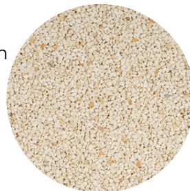
Marfil Tamaño: 2-4 y 4-6 mm