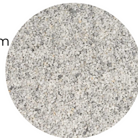
Light Grey Tamaño: 2-4 y 4-6 mm