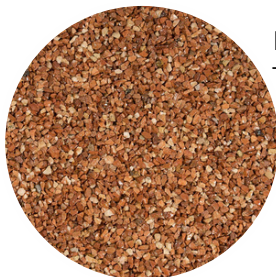
Red Tamaño: 2-4 y 4-6 mm