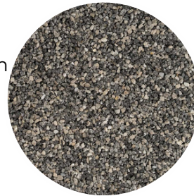
Dark Grey Tamaño: 2-4 y 4-6 mm